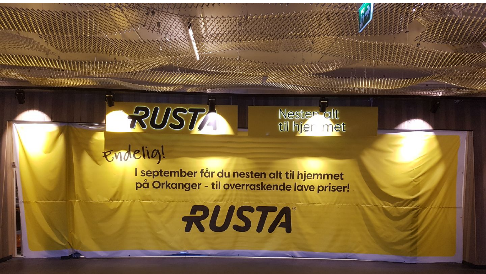
Rusta entré, OTI-sentret Orkanger