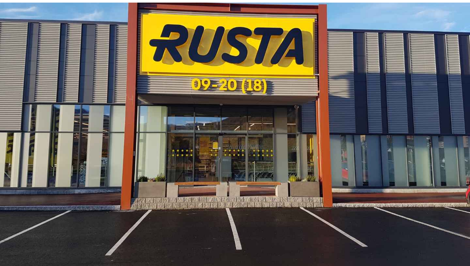
Rusta entré, Narvik