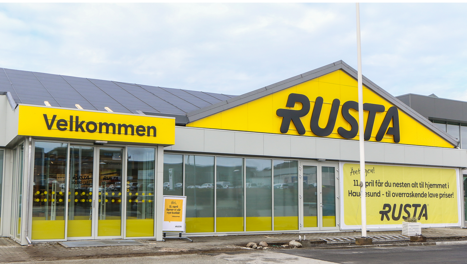
Rusta Haugesund